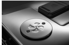
Turbo Drying™ – Con un flusso d'aria più intenso del 25%, ogni carico è completamente asciutto. Dopo il ciclo di risciacquo finale, l'aria umida all'interno della lavastoviglie si mescola con l'aria secca proveniente dall'esterno, in modo che piatti, bicchieri e posate siano completamente asciutti.