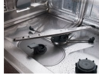
8 Steel™ – Otto dei componenti più importanti delle nostre lavastoviglie sono realizzati in acciaio di alta qualità anziché in plastica, compresi i contenitori, i cassetti, gli ugelli di spruzzo, i bracci irroratori, i setacci, la base esterna, i piedini e l'elemento riscaldante.