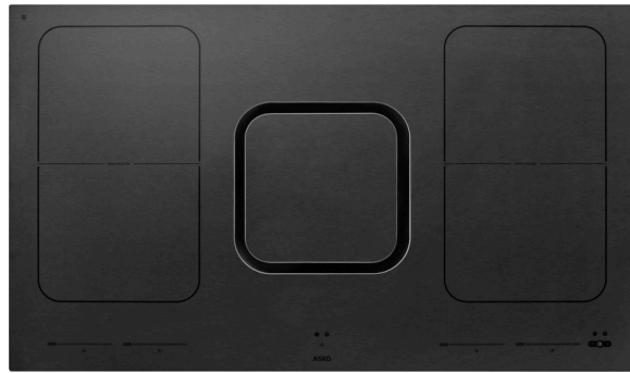
Table à induction avec hotte intégrée ▲ - HIHM 934 M